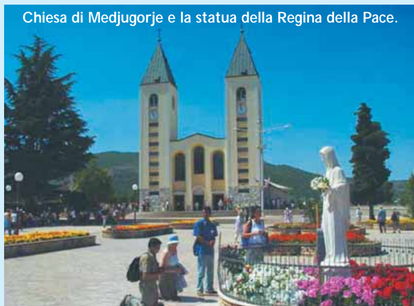
Chiesa di Medjugorje e la statua della Regina della Pace.