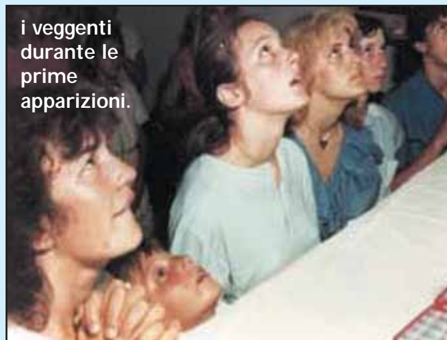
i veggenti durante le prime apparizioni.