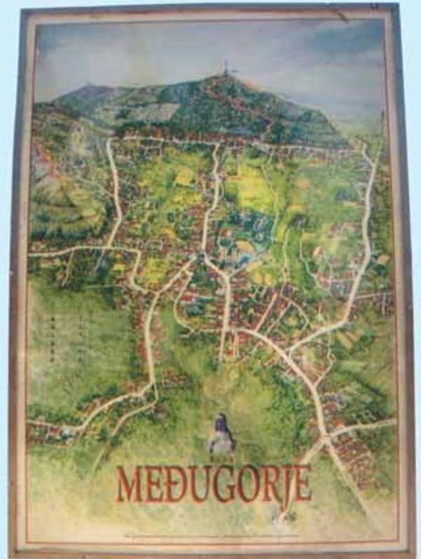
Cartina di Medjugorje.