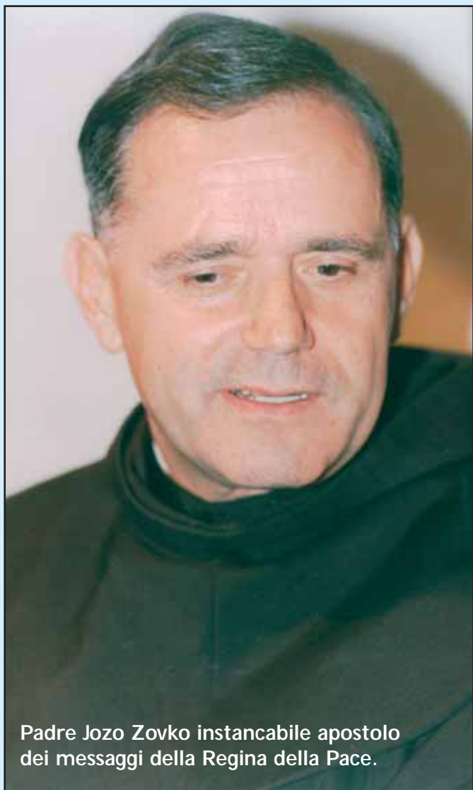
Padre Jozo Zovko instancabile apostolo dei messaggi della Regina della Pace.

Siamo qui oggi per una intera giornata di digiuno e preghiera, per ciascuno di voi, per la vostra patria che si trova davanti a una grande responsabilità per il futuro del paese. La vostra nazione è prossima alle votazioni. Una coscienza cristiana non può, e non deve dare il proprio voto a chi non crede in Dio. Non può dare voce a chi distruggerà la morale, la famiglia, Dio, la domenica e tutta la civilizzazione dell'amore cristiano evangelico. Dobbiamo pregare che il Signore susciti in Italia i suoi profeti con una morale nobile e cristiana, che sappiano vivere per il loro popolo e la loro Chiesa. Che questa giornata della preghiera sia un sincero appello davanti al Signore e alla Regina della Pace per la vostra patria e la vostra Chiesa. Vedo questa giornata come un grande dono e una grazia per tutto il popolo.