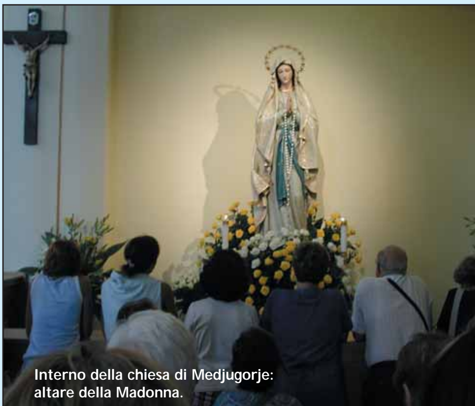
Interno della chiesa di Medjugorje: altare della Madonna.

Mi ritengo veramente privilegiato per avere potuto sperimentare direttamente cose così belle e per avere avuto personalmente segni così tangibili della presenza di Maria a Medjugorje, e non ho potuto fare a meno di accompagnare negli anni successivi e fino ad oggi centinaia di pellegrini in questo luogo santo, cercando di fare loro gustare la grandezza della loro chiamata. Ma soprattutto, in questi ultimi 22 anni, ho capito per la mia vita che accogliere i fenomeni, i “segni”, le apparizioni e i miracoli non equivale ad accogliere la Madonna come Ella ci chiede. Ho capito che i fenomeni, i segni, sono le grazie per partire, mentre la strada per raggiungere Dio è molto lunga e prevede che, in ciascuno di noi, tutto il nostro essere si risvegli e cammini per tendere al raggiungimento di quella contemplazione di Dio, che è “vedere Dio