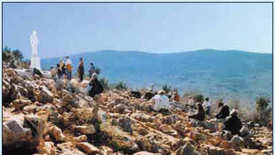
Podbrdo: la bianca statua della Regina della Pace. Luogo che ricorda dove i veggenti hanno visto la Madonna nelle prime apparizioni.