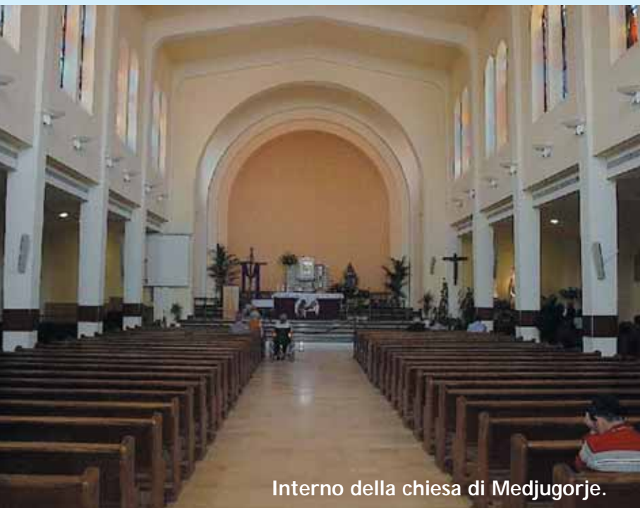
Interno della chiesa di Medjugorje.

di pellegrini. Il Podbrdo, chiamato oggi Collina delle Apparizioni , è il luogo delle prime apparizioni della Regina della Pace. Dal villaggio di Bijakovici, un sentiero ripido di circa mezz'ora di cammino raggiunge il luogo delle prime apparizioni. Bassorilievi in bronzo del Prof. Carmelo Puzzolo, che rappresentano i misteri gioiosi e dolorosi del rosario, sono stati posti lungo la strada nel 1989. Durante la salita, sulla destra, si incontra una grande croce in legno, che segna il posto dove, il terzo giorno delle apparizioni, la Vergine ha invitato per la prima volta alla pace attraverso Marija Pavlovic. Il luogo dove i veggenti hanno visto la Madonna la prima volta è contrassegnato da una grande statua bianca della Regina della Pace, scolpita secondo il modello di quella che si trova sul sagrato della chiesa (opera di Dino Felici). E' stata collocata in occasione del 20° anniversario. Nel giugno 2002, sono stati posti i bassorilievi in bronzo che rappresentano i misteri gloriosi (anch'essi opera del Prof.