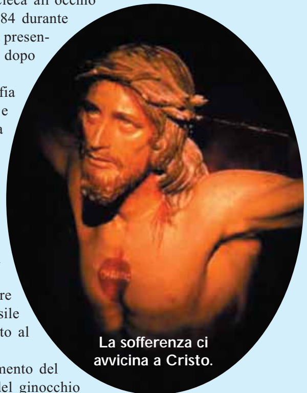
La sofferenza ci avvicina a Cristo.