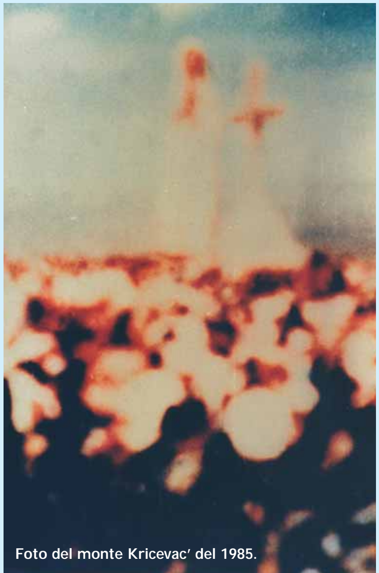
Foto del monte Kričevac' del 1985.

Come la Fede cristiana, anche la Speranza si pone in termini abbastanza precisi: tipico è il ricorso alla Madre di Dio e Madre Nostra. Non si tratta di "recessione psicologica"; talora è piuttosto un'apertura all'infinito, un aprire il cuore all'implorazione ed alla supplica. Per questo il pellegrinaggio a luoghi sacri, ai