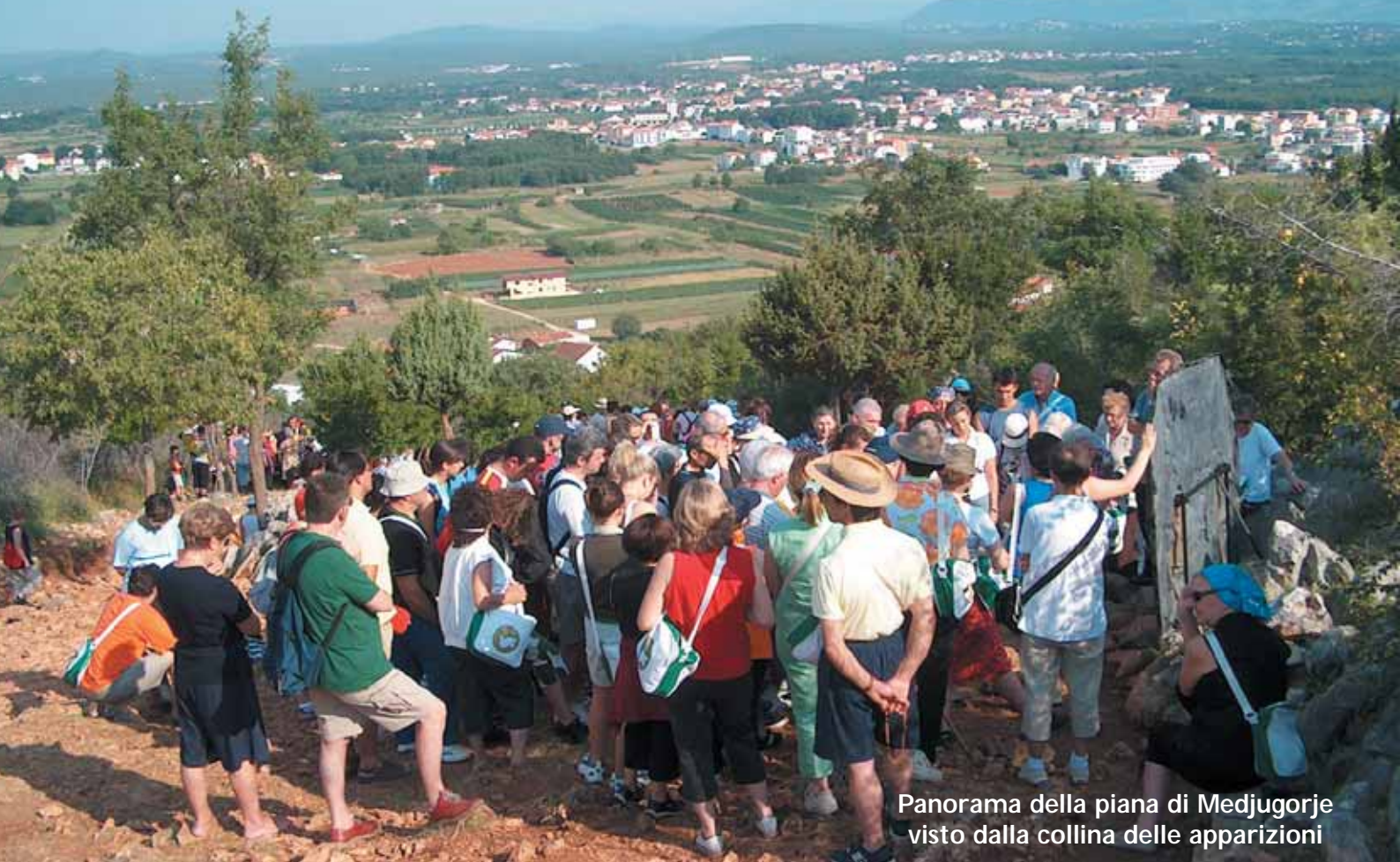
Panorama della piana di Medjugorje visto dalla collina delle apparizioni

Le persone che non hanno ancora avuto l'occasione di andare a Medjugorje, spesso si chiedono dove sia, come sia, quale la sua storia, ... E' una curiosità che spinge ad approfondire l'interesse per questo paesino che, così piccolo, silenzioso e umile, da 25 anni si trova al centro del mondo e al centro degli interrogativi di milioni di persone, fedeli cattolici, cristiani di altre chiese, di uomini e di donne in ricerca del senso della vita e di sé stessi. Pensiamo allora di fare una cosa utile e gradita, descrivendo Medjugorje a partire dalle informazioni date dalla stessa Parrocchia e dalle parole dei pellegrini che là si sono già recati.